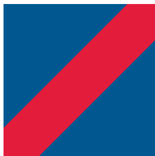
ukośna szarfa barwy czerwonej