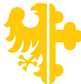
uproszczone godło Opola